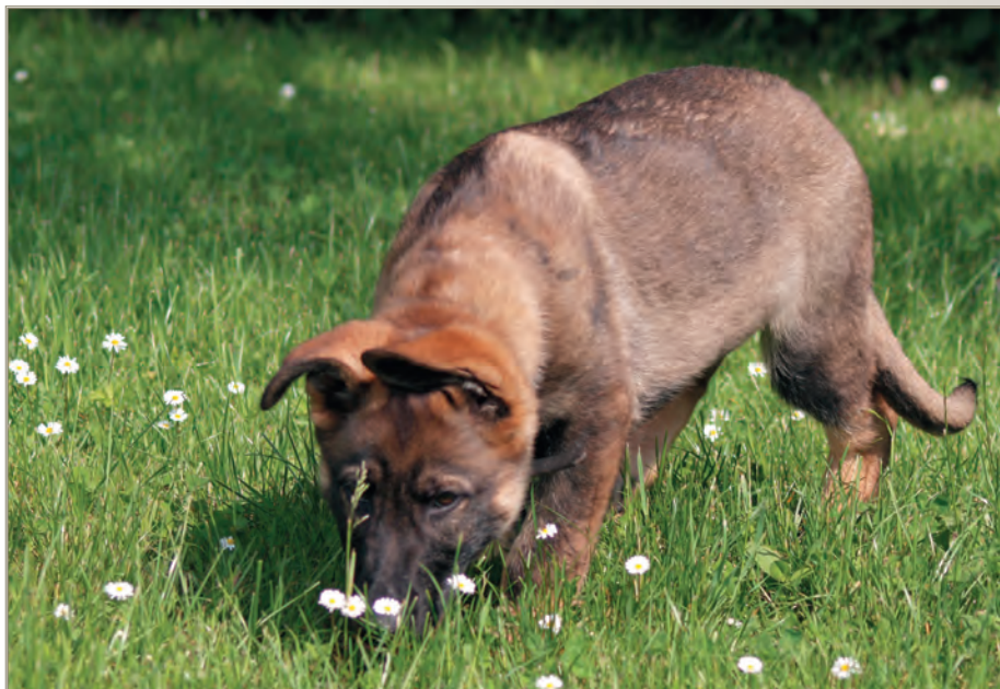
Das «Geheimnis» aussergewöhnlicher Nasenleistungen und Fährtenarbeiten liegt nicht in der «Entschlüsselung» irgendwelcher Gene, sondern im Verständnis des frühen natürlichen Lernverhaltens und seiner praktischen Nutzanwendung.

Kanalisiert man bei Katastrophen- und Rettungshunden das eigendynamische Lernen frühzeitig in der rechten Art, dann wird es überflüssig, Hunde im Erwachsenenalter so zu trainieren, dass sie letztlich die belohnende Wurst und nicht wirklich den zu bergenden Menschen suchen. In diesem Zusammenhang dürfte es interessant sein, zu wissen, dass eine der wohl anspruchsvollsten Hundeausbildungen, nämlich die des Blindenführhundes, prinzipiell ohne Futterbelohnung durchgeführt werden kann (Beispiel: Blindenführhundeschule Allschwil, Schweiz).