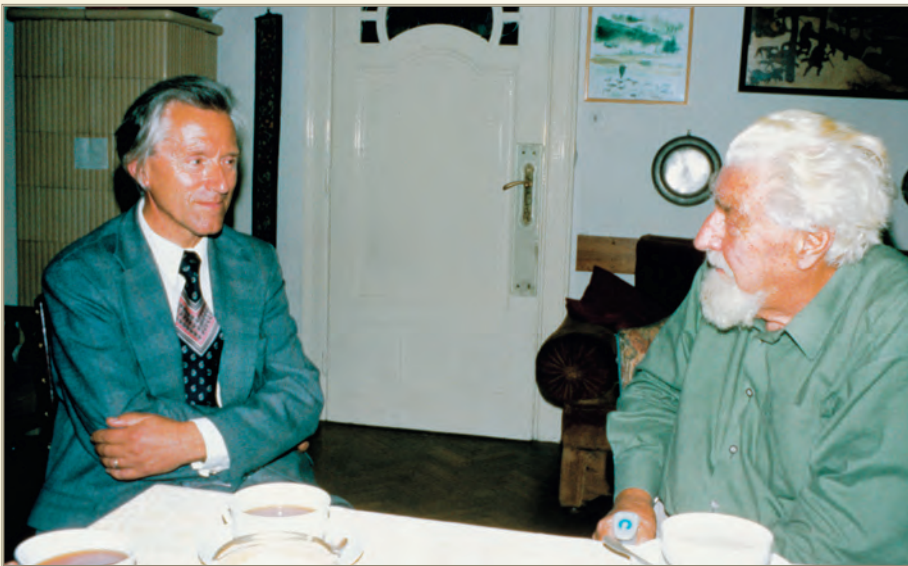
Konrad Lorenz (1903–1989, Nobelpreis 1973) und Bernhard Hassenstein (links) im Gespräch, Altenberg bei Wien im Hause Lorenz 1985.

Die Teilnahme an einem Dressurlehrgang mit dem eigenen Jagdgebrauchshund