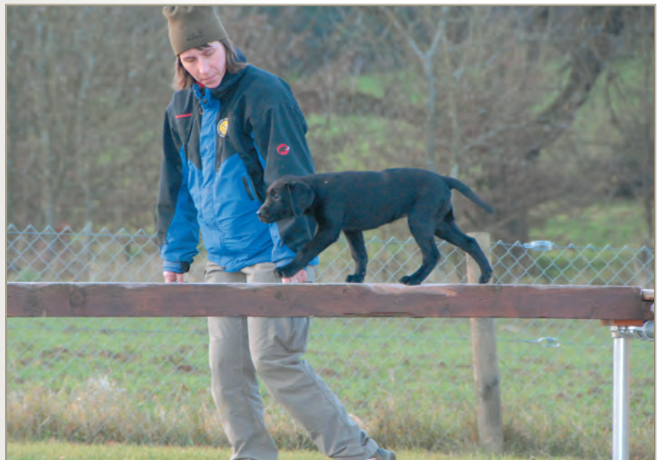
Damit ein Hund möglichst Hund und zugleich angenehmer Partner oder Helfer des Menschen sein kann, muss von Anfang an sein natürliches Lernen in eine Richtung kanalisiert werden, die auf Dauer für beide Seiten gut ist.

Damit das eigendynamische Lernen in der von Natur aus möglichen und in der von uns Menschen erwünschten Form zustande kommen kann, müssen die dazu nötigen inneren und äusseren Voraussetzungen erfüllt sein. Nochmals kurz gefasst, ist es zunächst die sichere Bindung zum Fürsorgegaranten , die dem am Anfang seiner Entwicklung stehenden Hund die emotionale Sicherheit gibt, sich mit seiner natürlichen, sozialen und zivilisatorischen Umwelt aktiv und positiv gestimmt auseinandersetzen zu können. Mit dem angeborenen Bedürfnis, die für ihn bedeutsamen Zusammenhänge seiner anfänglich noch kleinen Welt erfassen zu können, sucht er nach Erfahrung ( Appetenzverhalten ). Wird der dann schon mit wenigen Wochen aktive Welpen weder durch Vorenthaltung, also durch Erfahrungsentzug , noch durch Überbehütung an der Erfüllung seiner natürlichen Bedürfnisse gehindert, setzt sich ein selbstfördernder Lern- und Entwicklungsprozess in Gang. Unter der weichenstellenden Wirkung von Ersterlebnissen entwickelt sich zunehmend seine eigene Motivation , deren Entfaltung über den Weg der Selbstwirksamkeit immer mehr in erfahrungsabhängige Strategien des Lernens und schliesslich in solche der Lebensbewältigung übergehen. Die in diesem frühen Lebensabschnitt beteiligten Vorgänge der Prägung und prägender Lern-