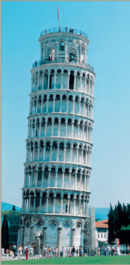
Die PISA-Studie zum Lernverhalten unserer Schüler hat mit dem schiefen Turm von Pisa nichts zu tun (Abbildung). Dennoch drängt sich eine Gedankenverbindung auf: In beiden Fällen ist unübersehbar, dass etwas aus dem Lot geraten ist.

Entwicklung (OECD) getragen. Diese PISA-Studie hat also nichts mit der althistorischen italienischen Stadt Pisa und ihrem schiefen Turm zu tun. Dennoch drängt sich hier eine Gedankenverbindung auf: Wie der schiefe Turm von Pisa allgemein bekannt ist, wurde nun durch die PISA-Studie für die Allgemeinheit bekannt, dass bei unseren etablierten Systemen des Lernens etwas aus dem Lot geraten ist und offensichtlich einiges schief läuft.