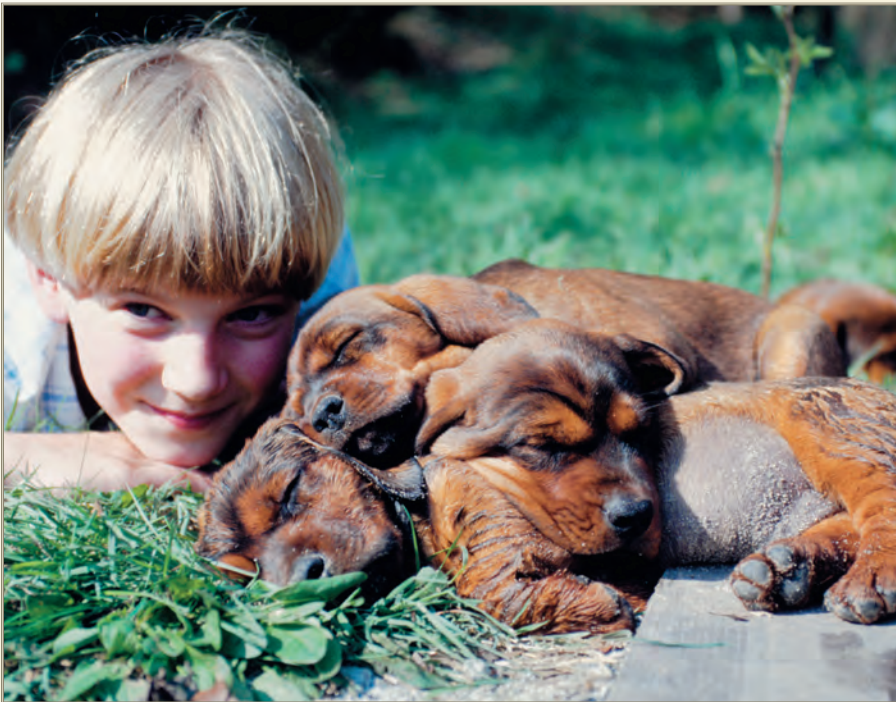
Es geht um ein besseres Verständnis und Gestalten des Lernens und Lehrens bei unseren jungen Lebewesen.

Aus langjähriger und vielseitiger Praxis heraus wird hier der zugehörige wissenschaftstheoretische Hintergrund zur nötigen Verbesserung nachvollziehbar dargestellt. So kann theorie- und erfahrungsgestützt ein wichtiger Teilaspekt des Lernens – das eigendynamische Lernen – methodisch aufbereitet zur praktischen Anwendung im Sinne einer zukunfts-trächtigen Lernbiologie vermittelt werden.